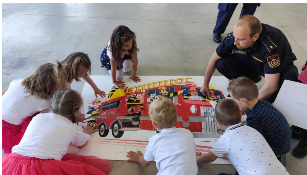
suradnja s Vatrogasnom zajednicom Gornji Kneginec