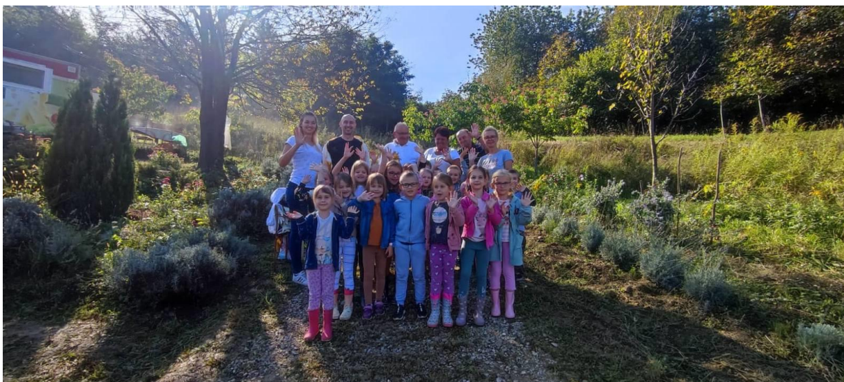
udruga pčelara vrlo aktivno surađuje s našim vrtićem