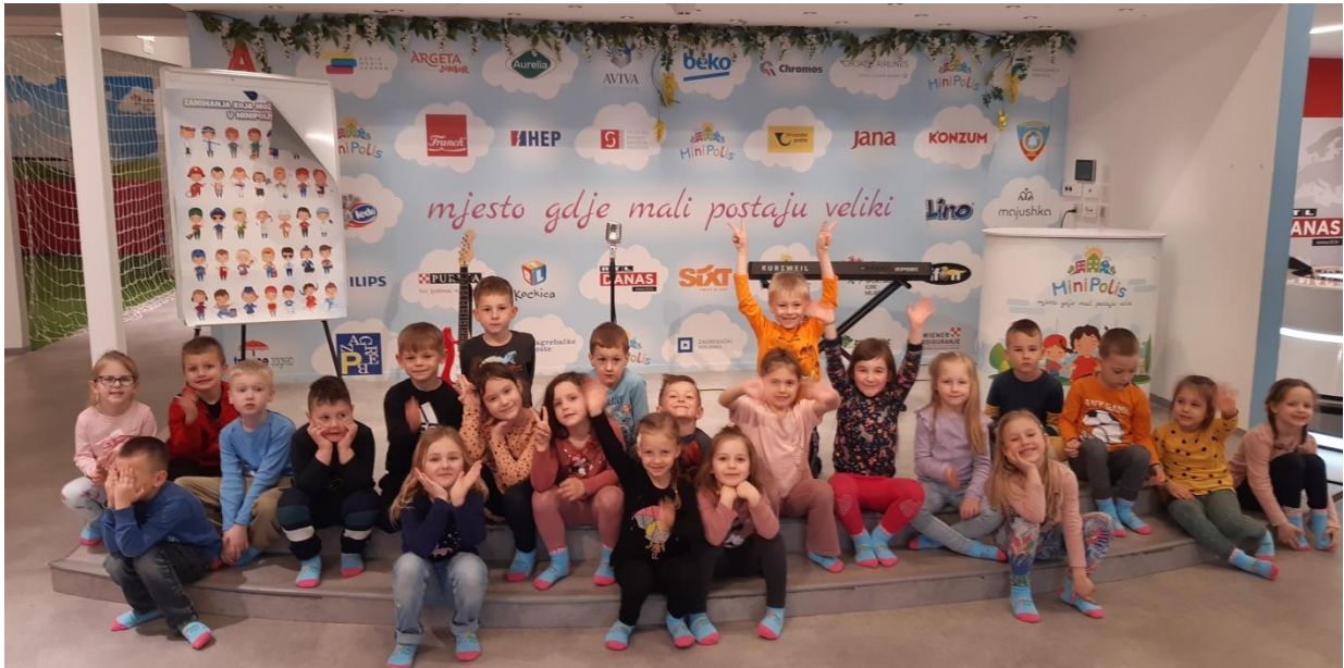
Izlet u Zagreb- Minipolis