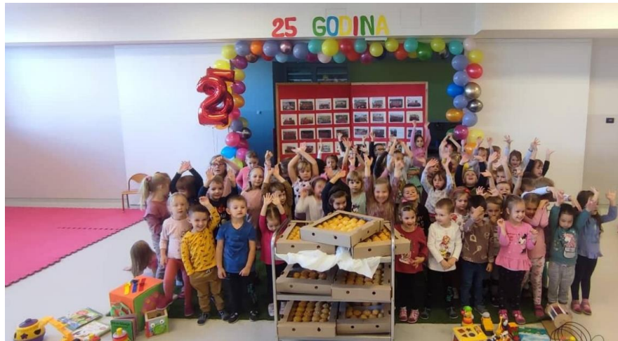
Općina Gornji Kneginec darivala mališane za 25-ti rođendan vrtića