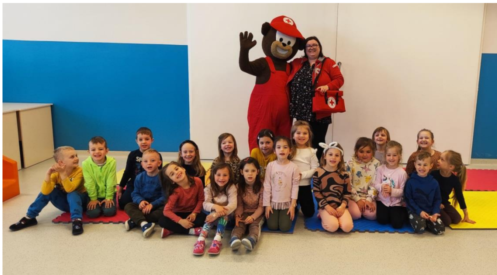
za Dan zdravlja- edukativni sadržaji u suradnji s Crvenim križem Varaždin