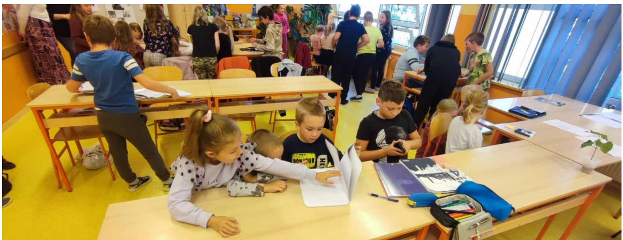
dobra suradnja s Osnovnom školom Gornji Kneginec