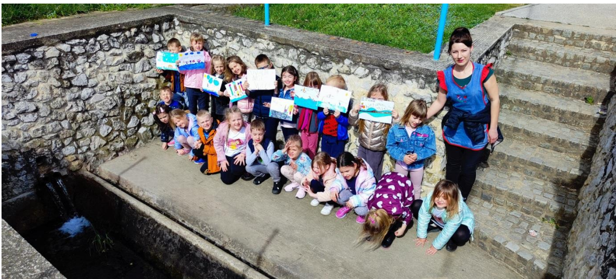
edukativne aktivnosti za Dan voda