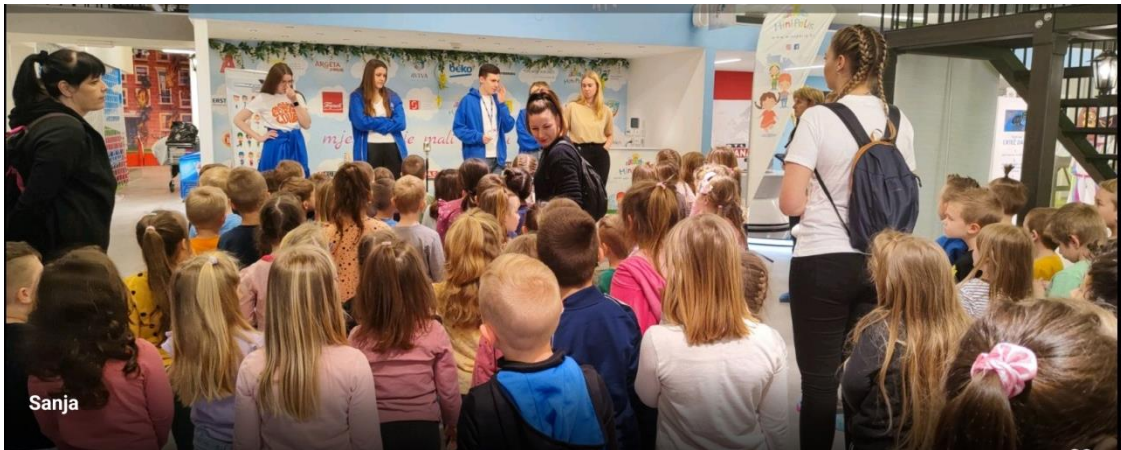
Dan planete Zemlja -edukacija od rane dobi o važnosti očuvanja prirodnih resursa