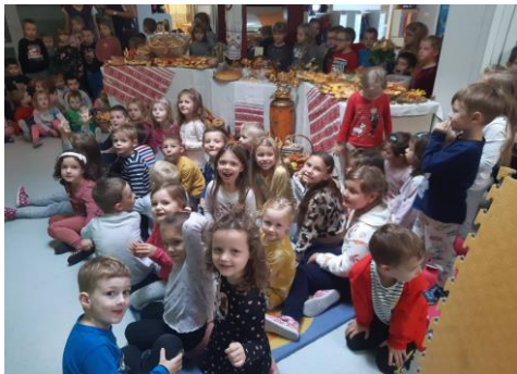
Dan kruha- izrada pekarskih proizvoda, (prezentacija izrade klipića), izrada plakata, blagoslov kruha i plodova jeseni u crkvi Sv. Marije Magdalene