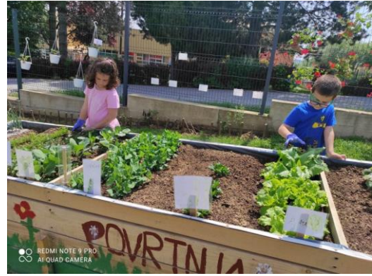
svakodnevne radne aktivnosti u vrtu