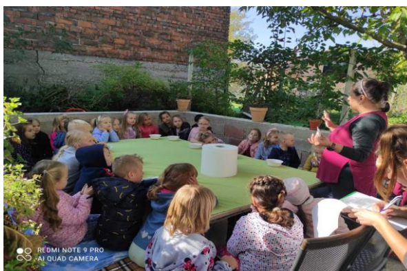
Dan učitelja-posjeta Osnovnoj školi Gornji Kneginec