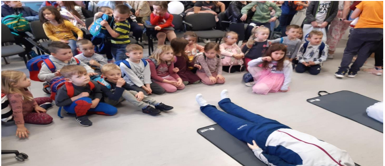
Svjetski dan srca - razvoj svijesti o važnosti fizičke aktivnosti i prehrane na zdravlje srca, doživljaj kucanja srca u mirovanju i nakon fizičke aktivnosti likovno izražavanje, izrada plakata