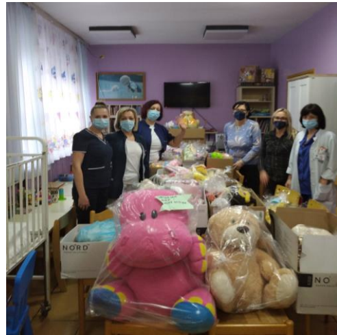
donacija igračaka i slatkih paketića za bolesnu djecu

Ishod: dobrobit za djecu koja su osvijestila kako svojim malim odricanjima mogu činiti velika i dobra djela. dobrobit za roditelje koji su svojim trudom pozitivno socio-emocionalno utjecali na vlastitu djecu i na širu zajednicu.