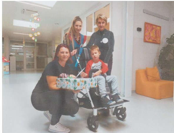
predan poklon dječaku prikupljen od humanitarne akcije

razvijanju empatije, tolerancije i prihvaćanju razlika među osobama i opći napredak suradničkih vještina. Za uspješno uključivanje djece s teškoćama važno je razumijevanje koncepta ravnopravnog dostojanstva koje prije svega uključuje prihvaćanje djeteta kao osobe. Prolazne ili privremene teškoće uočene kod troje djece, a trajna teškoća u razvoju kod jednog djeteta koje je imalo pomagača.