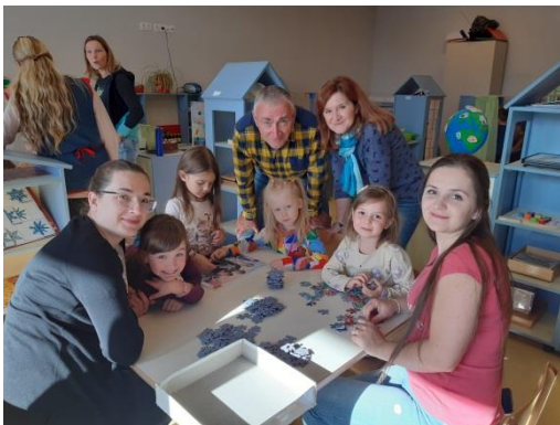
suradnja s roditeljima: kreativne radionice