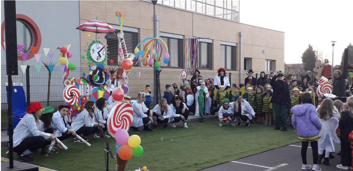
prigodnim programom obilježen Fašnik