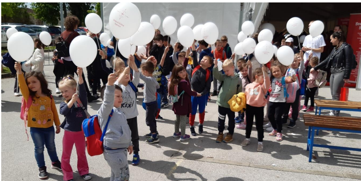
posjeta radionicama u Sveučilištu sjeve