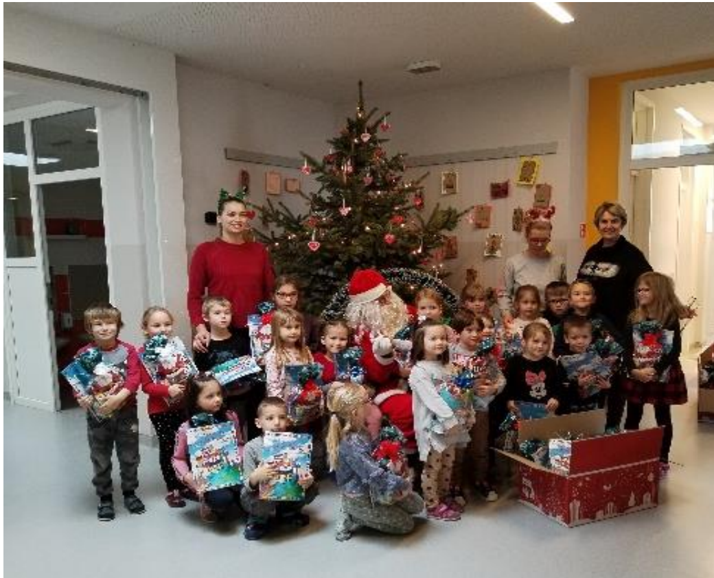
prosinac- radost povodom dolaska Djeda Mraza