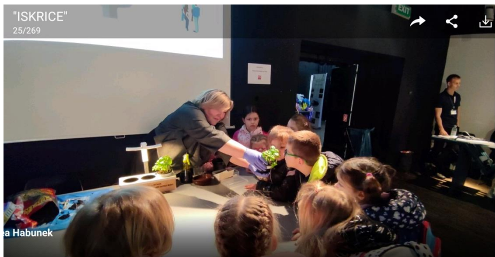
Dan festivala znanosti u Tehničkom muzeju Zagreb