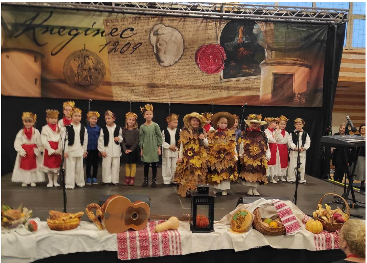
manifestacija Veseli Knežinec