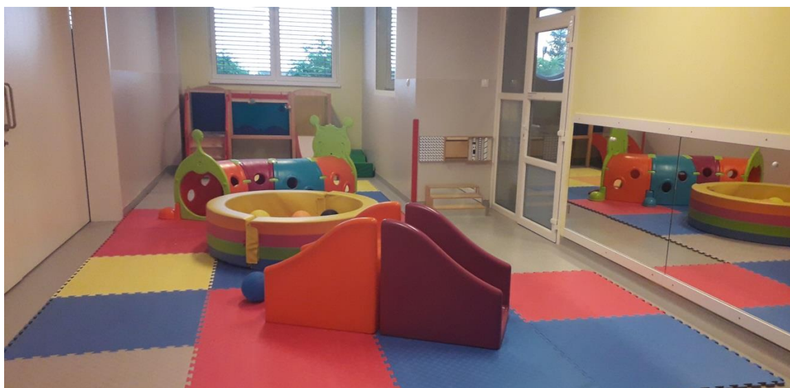
mala dvorana za djecu rane dobi

bogato prostorno-materijalna opremljenost