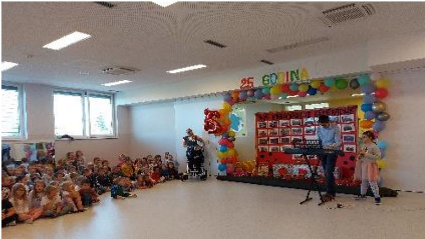
nastup učenika glazbene škole