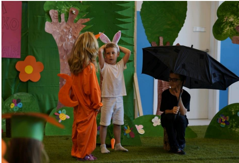
scenska igra: Prijateljstvo

Ishod: sposobnost komunikacije govorom, gestama i mimikom, tijelom, kreativnost, samopouzdanje, pozitivno socio-emocionalno stanje