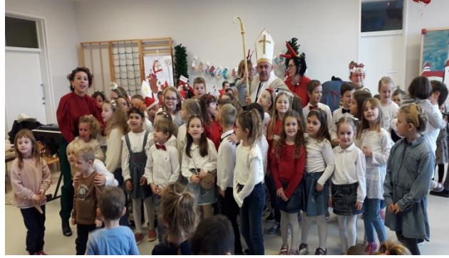
doček Sv. Nikole upotpunila djeca Dječjeg zbora