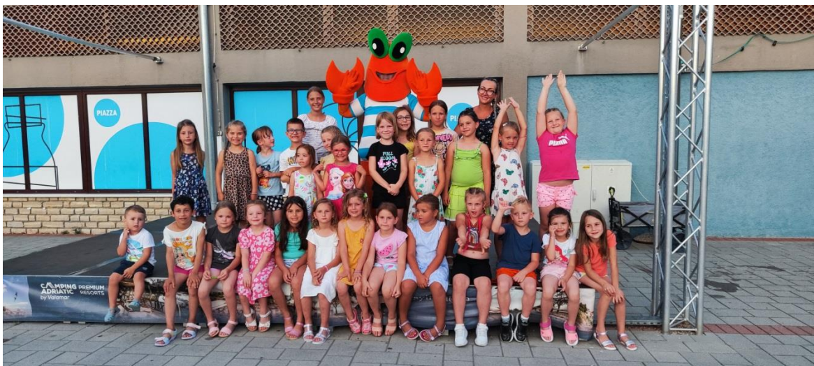
14. – 19. srpanj- ljetovanje u "Dječjem odmaralištu Varaždin na Rabu"