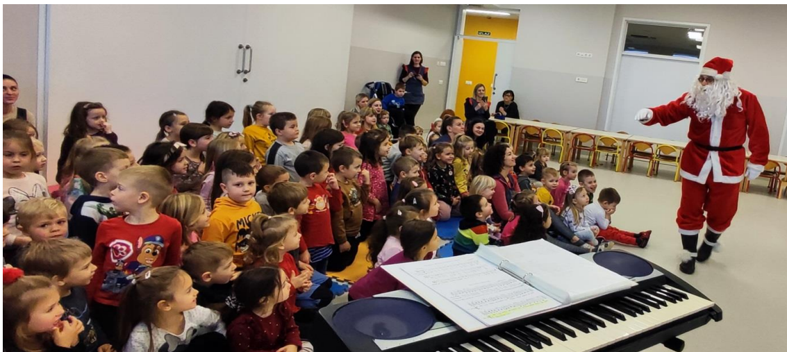
prigodnim programom dočekali smo Djeda Mraza