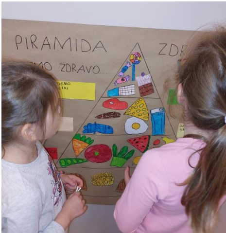
učenje o zdravoj prehrani

Djeca u desetosatnom programu dobivaju četiri obroka: zajuttrak, doručak, ručak i užinu, dok u petosatnom programu dobivaju dva obroka (doručak i ručak). U prijedodnevni satima djeci je dostupno voće.