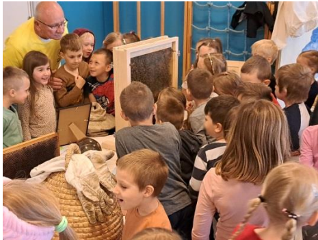
Dan pčela- Udruga pčelara prezentirala život i proizvodnju hrane najkorisnijeg kukca