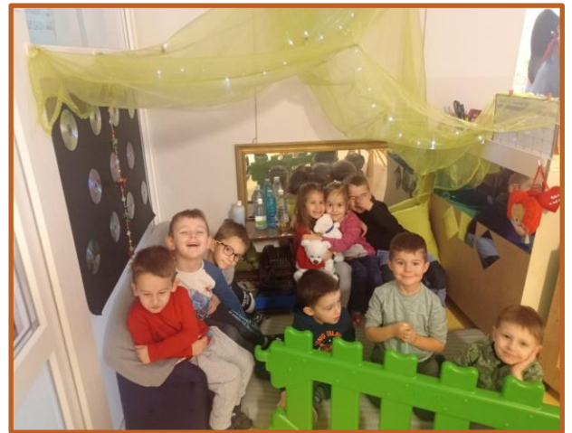
stvaranje pozitivnih socio-emocionalnih veza