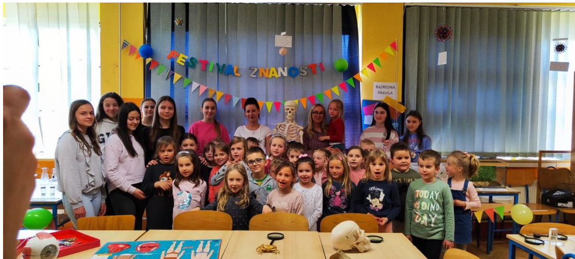
suradnja s Osnovnom školom Gornji Kneginec - prisustvovali smo na Festivalu znanosti