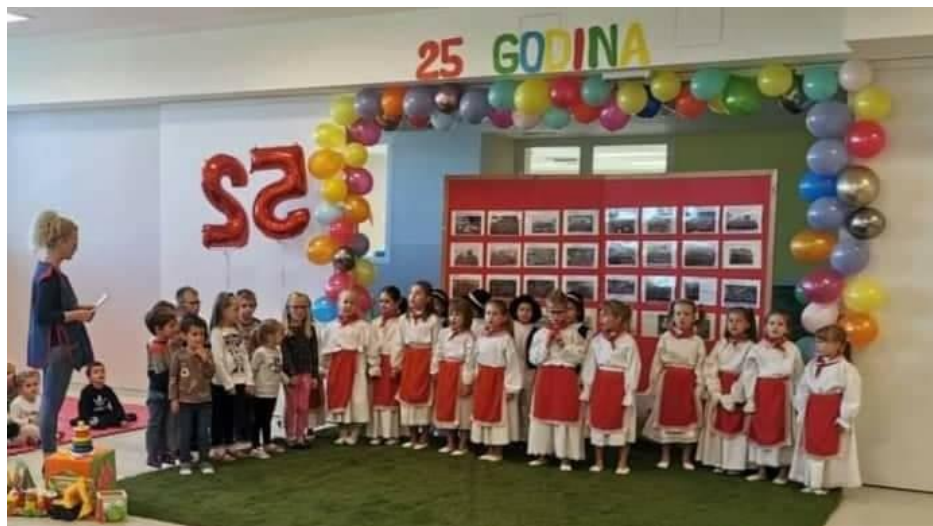
prigodni program za Dan vrtića izveli mališani skupine Pčelice