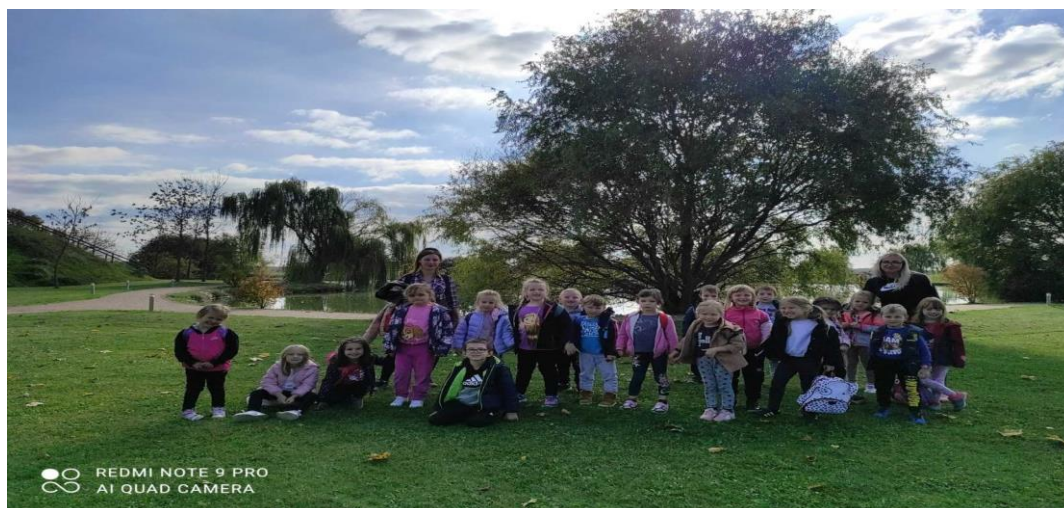
Izlet u Krašograd