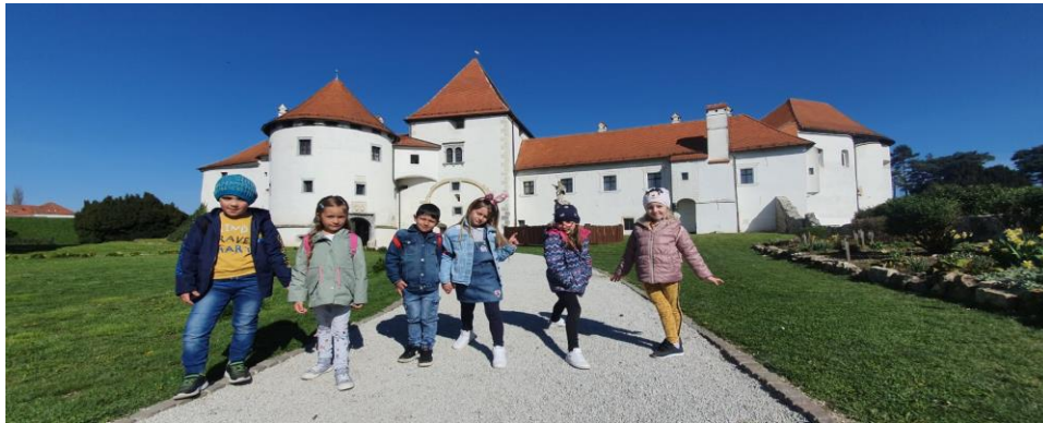
Izlet u Varaždin: šetnja stazama starog grada, posjeta kazalištu-predstava: Jaje