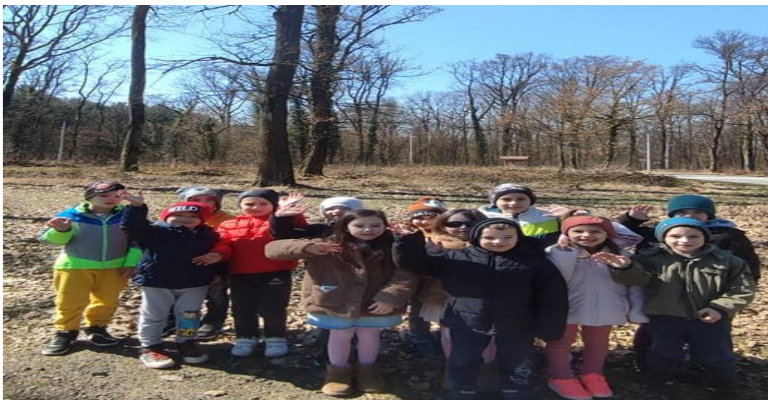
Dan planeta Zemlja –šetnja, edukacija o prirodnim resursima naše planete