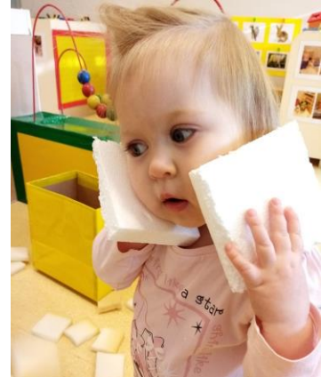
učenje u poticajnom okruženju vlastitom aktivnošću