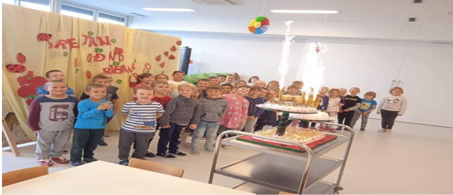
1.listopada obilježen 24-ti rođendan Vrtića