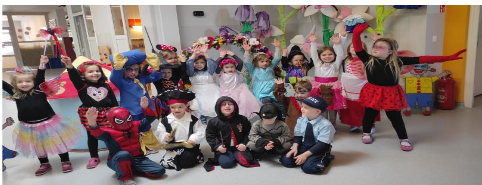
Dan kada se vesele sva djeca- sve je dozvoljeno