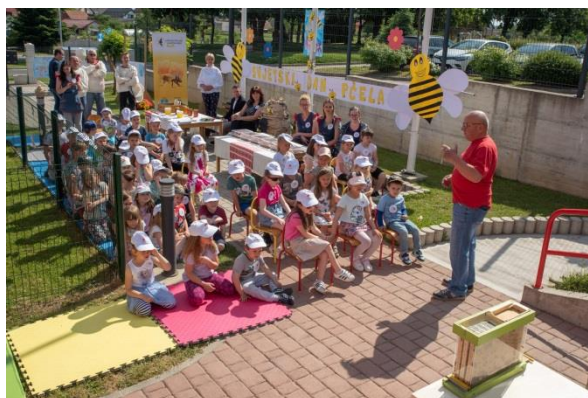
Dan pčela- Udruga pčelara prezentirala život i proizvodnju hrane najkorisnijeg kukca degustacija proizvoda od meda, darivanje