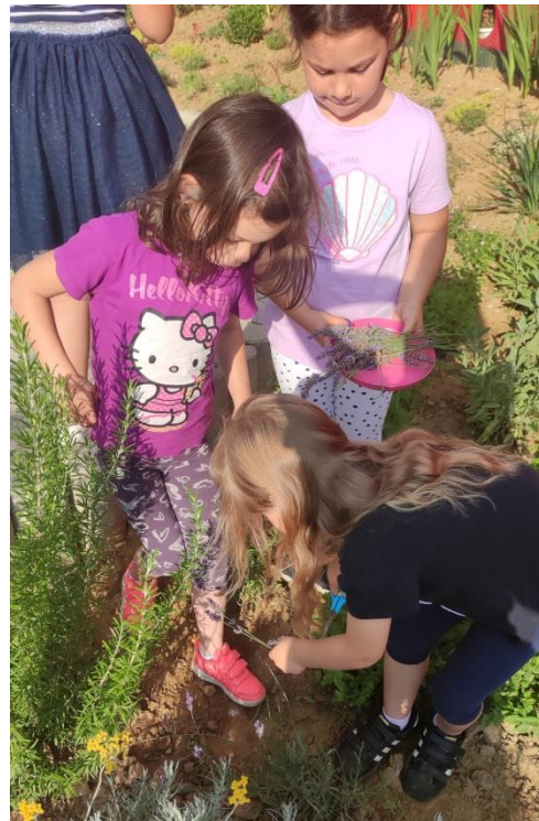
rad u vrtu i cvjetnjaku