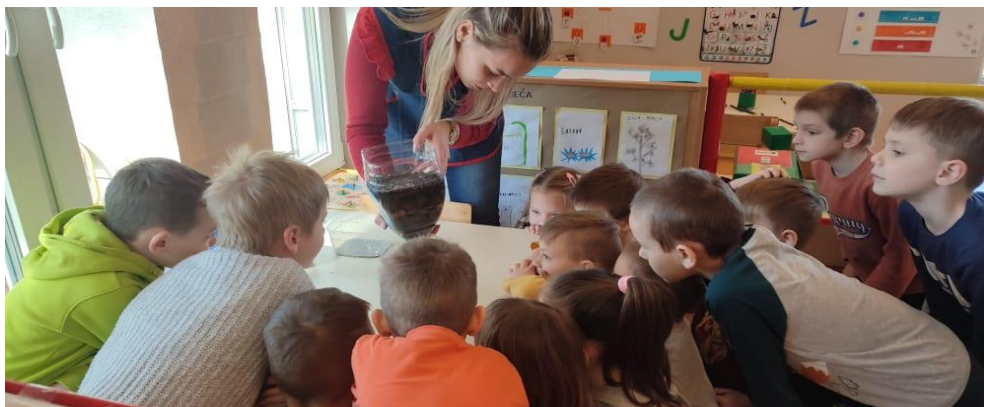
učenje metodom promatranja i demonstracije

Ishod: -radoznalost, kompetencija i inicijativnost, percepcija sebe kao osobe koja može i zna,