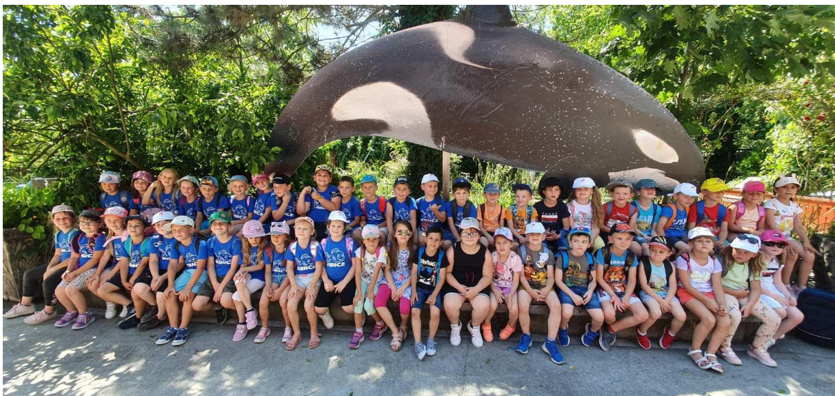
Skupina Ribice i Ježići u ZOO vrtu u Zagrebu