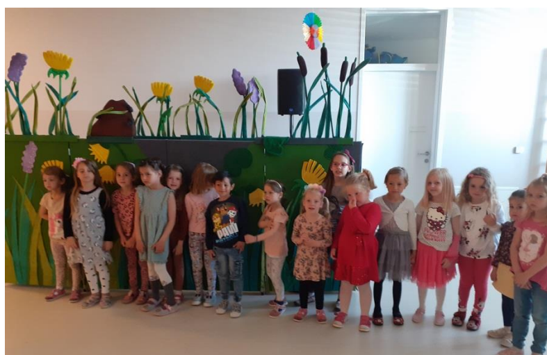
Dan obitelji, prigodan program