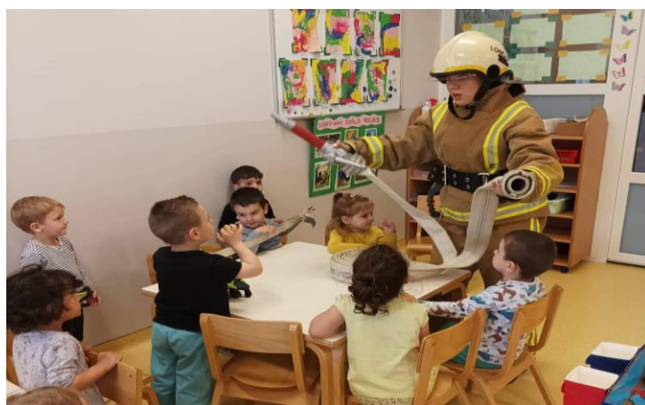
edukacija od rane dobi