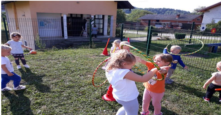
Dan tjelesne kulture- tjelesno-motoričke aktivnosti, plakat, edukacija o važnosti tjelovježbe