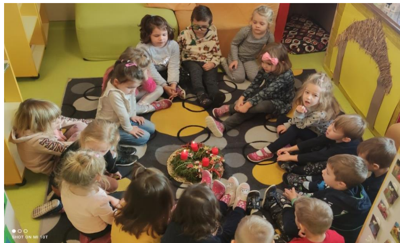
„Vrijeme adventa“ – okupljanje oko adventskog vjenčića uz molitvu i vjerske sadržaje, poruke mira i ljudske dobrote, izrada štalice, kićenje bora, izrada nakita, čestitaka, ukrašavanje prostora