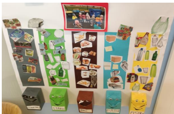
recikliranje- briga o okolišu