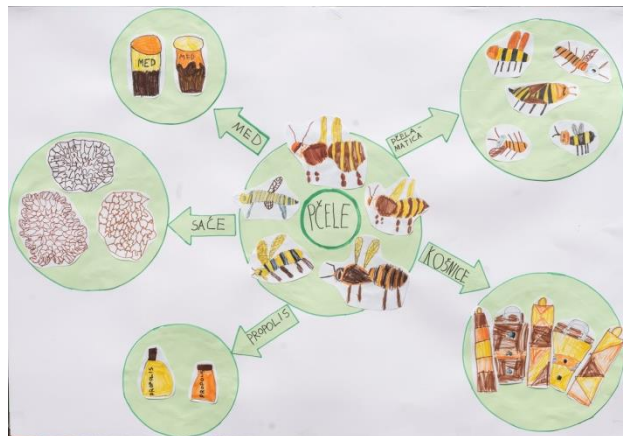
djeca spoznaje bilježe putem plakata

Ishod: sposobnost komuniciranja, pravilni gramatički izgovor, bogaćenje rječnika, razumijevanje fonološke strukture izgovorene i pisane riječi (glas, slovo), uočavanje razlike u izgovoru riječi za isti predmet na materinjem i stranim jezicima