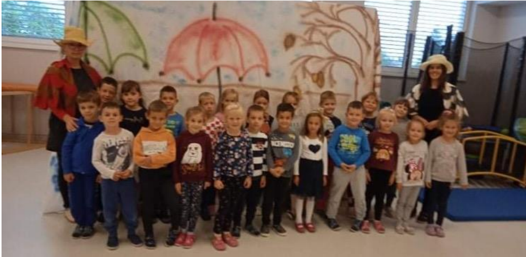
Dječji tjedan- interna predstava