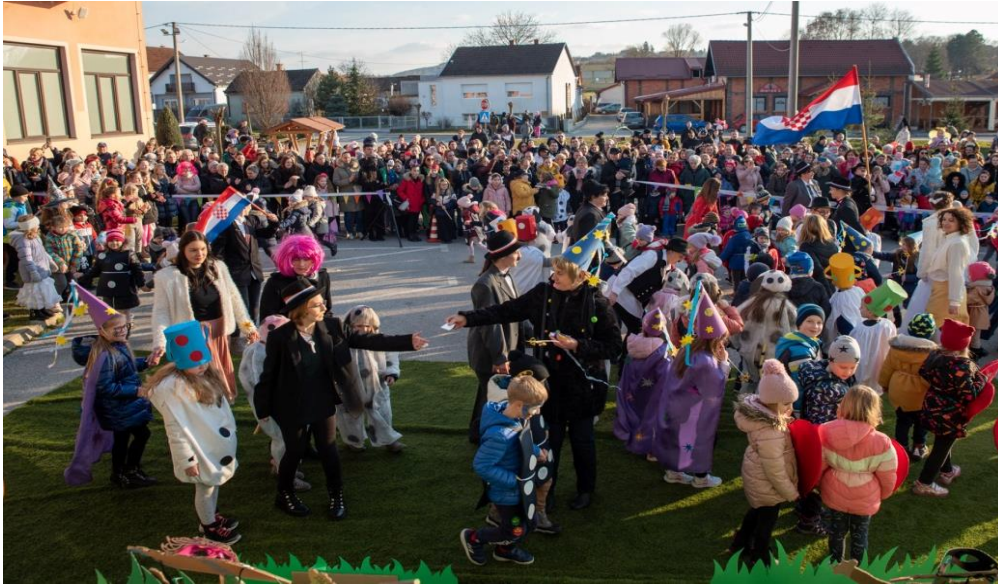
Fasnik: izrada maski, aktivnosti izražavanja, stvaranja, prigodni program