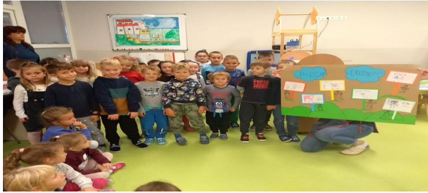
Svjetski dan ljubaznosti: edukativni sadržaji, životno-praktična aktivnost, plakat