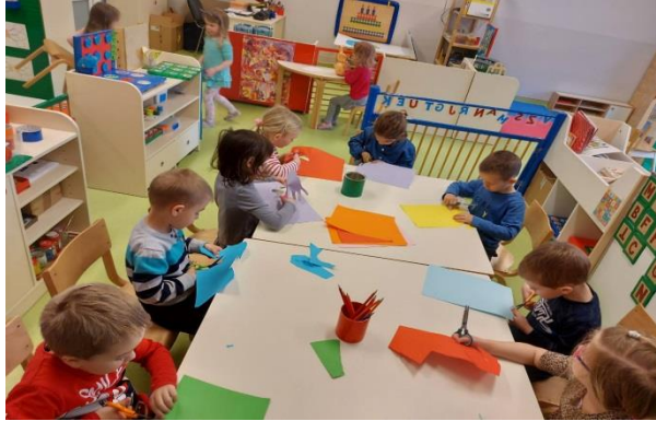
Kao predvježba pisanja-rezanje škaricama

Deca su se potpuno osamostalila u brizi o sebi (izuvanje, obuvanje, odijevanje). Isto tako djeca su samostalno koristila WC, usvojila naviku higijene ruku prije jela, nakon korištenja WC-a te kada su sami za to uvidjeli potrebu. U brizi o predmetima i prostoru Vrtića, djeca su pokazivala visok nivo discipliniranog ponašanja i to u vidu čuvanja, pospremanja stvari na određena mjesta, te održavanje čistoće i urednosti prostora nakon određenih aktivnosti i igre.