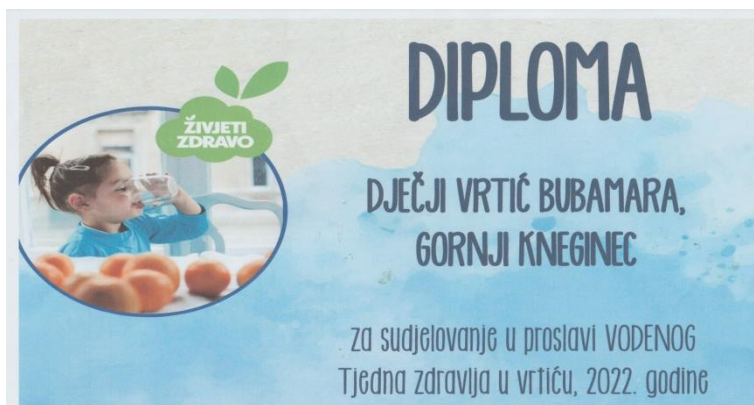
sudjelovanje u manifestaciji Vodeni tjedan