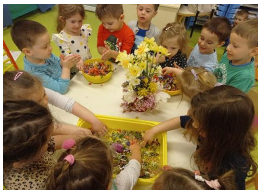
Cvjetnica-izrada mirisne vode