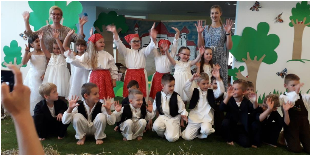
završna svečanost starije skupine Ježići