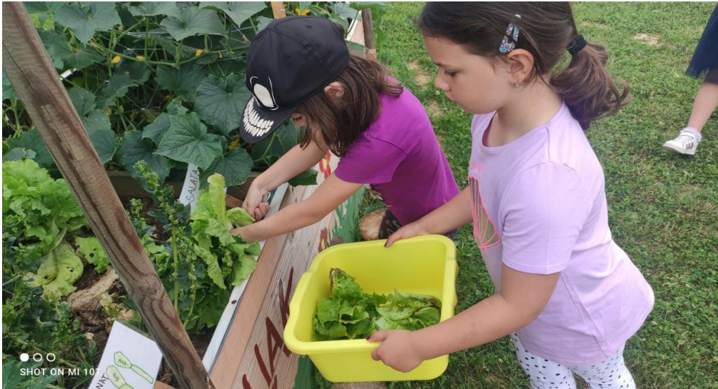
sami uzgajamo povrće