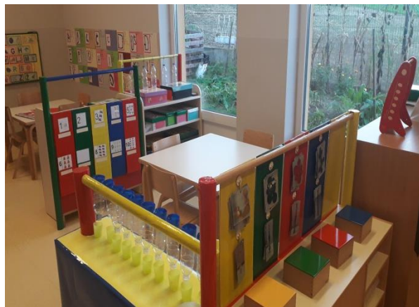
različiti centri aktivnosti

Prostor soba boravka djece strukturirao se u različite centre za aktivnosti. Centri su opremani adekvatnom, odgovarajućom vrstom materijala za istraživanje, igru i učenje (obiteljski centar, kuhinja, frizeraj, slastičarna, butik, centar početnog pisanja i čitanja, centri simboličkih igara, građevni centar, centar istraživanja i slično...).