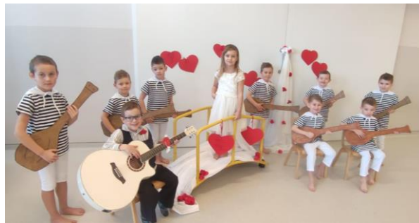
srce za svakoga