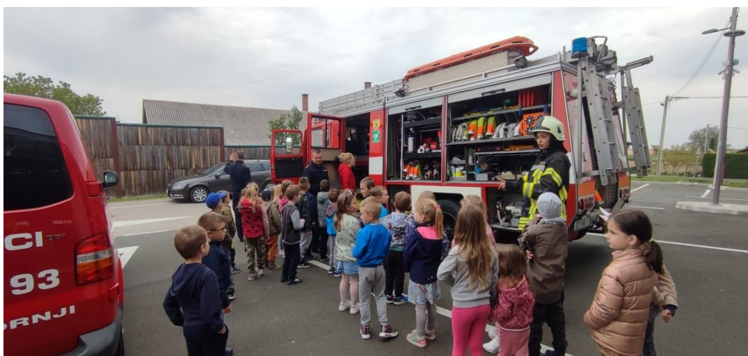
Susret s članovima DVD-a Gornji Knežinec