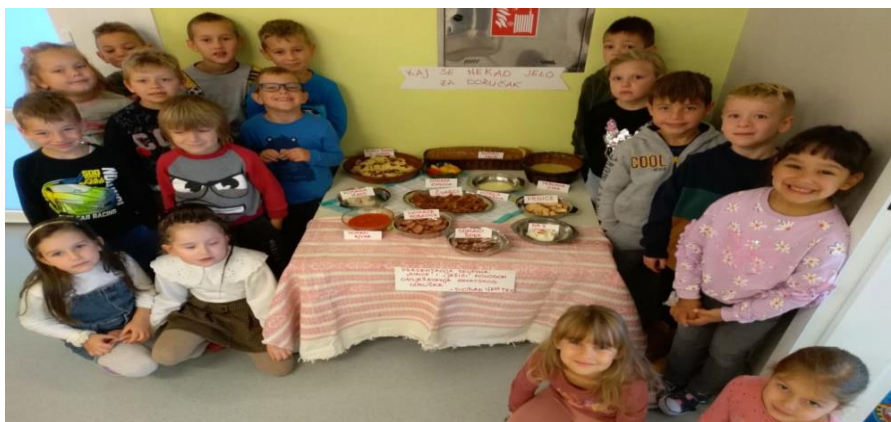
Dan hrvatskog doručka: prezentacija trdionalne hrvatske kuhinje, konzumira