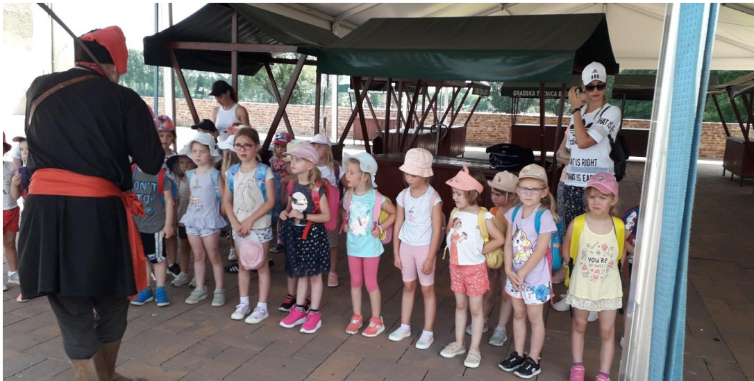
Izlet skupine Pčelice i Iskrice u Đurđevac