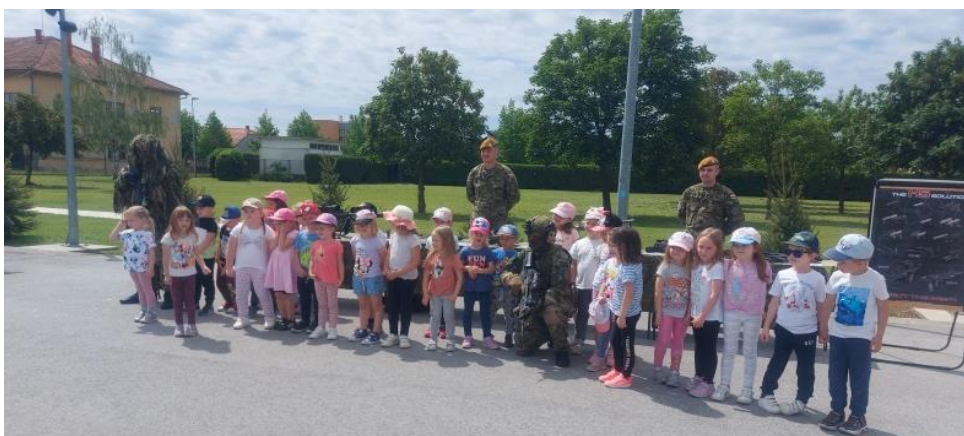
Posjeta vojnoj kasarni u Varaždinu