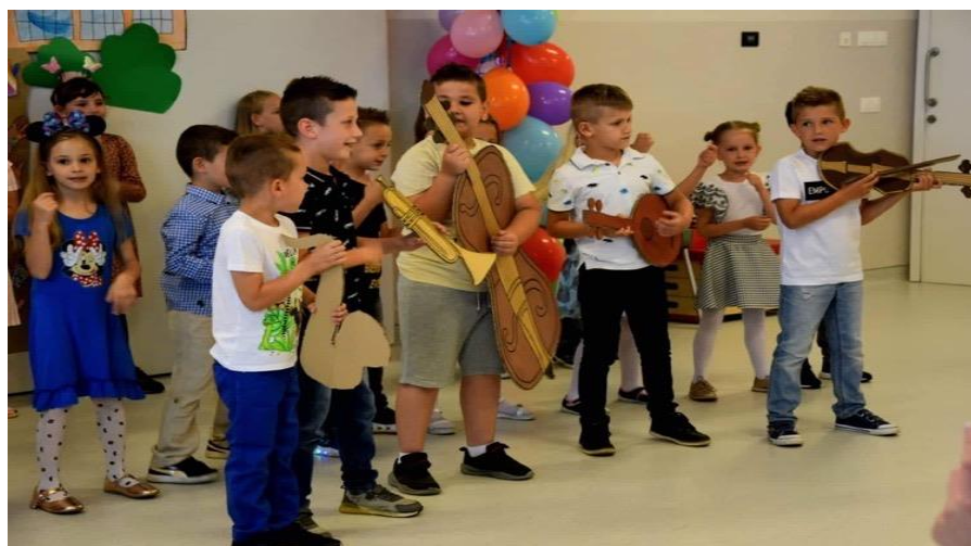
Završna svečanosti starije skupine „Ribice“