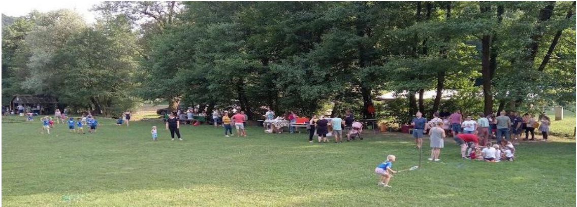
Sportske igre i druženje sa roditeljima u rekreacijskom centru "Slugovine"- Sektin