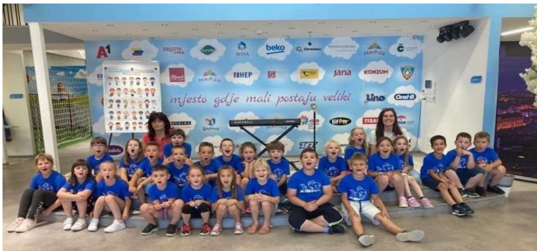
Izlet u „Minipolis“