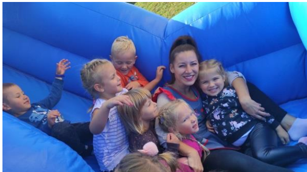
svako je dijete voljeno

Proces prilagodbe bio je postupan što znači da su djeca upisivana postepeno kako bi mogli individualizirati pristup djetetu i zadovoljavati njegove potrebe za nježnošću, pripadanjem, stvaranju socio-emocionalnih veza. Roditeljima je omogućeno da prve dane borave sa djetetom, a sam boravak djeteta prvih dana trajao je kraće (do 3 sata dnevno).