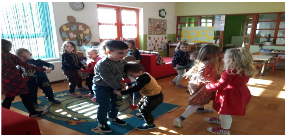
- Valentinovo – interna priredba i druženje, likovno i glazbeno izražavanje