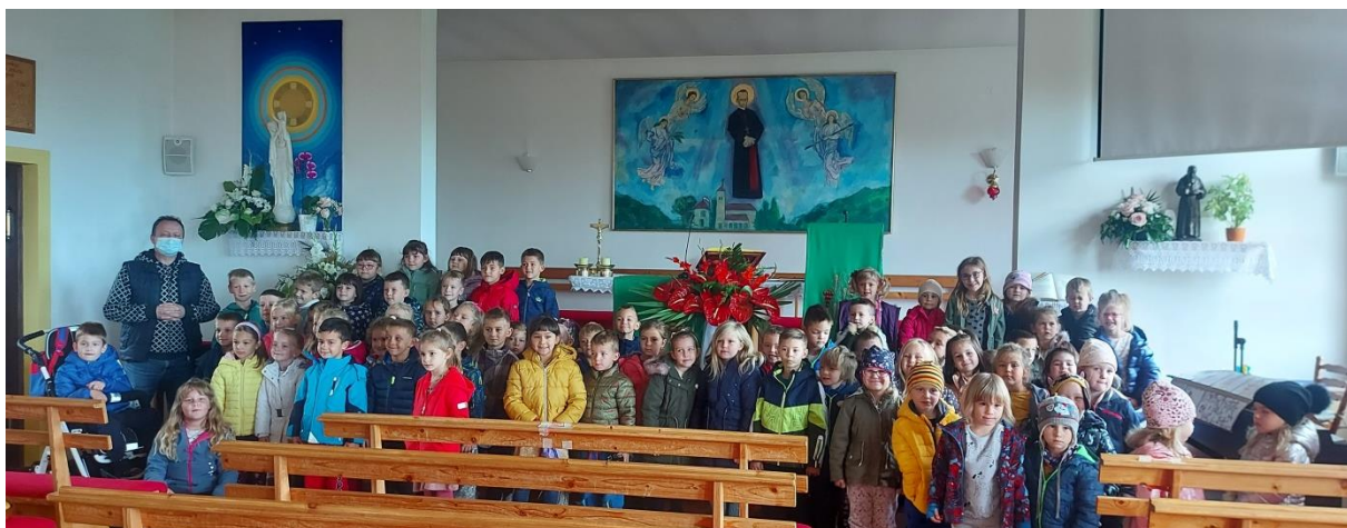
Dan kruha- izrada pekarskih proizvoda, (prezentacija izrade klipića), izrada plakata, blagoslov kruha i plodova jeseni u crkvi Sv. Marije Magdalene