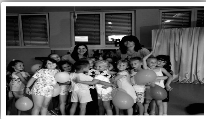
Pidžama party: posljednji dan vrtića s predškolicima završio u „kasnim satima“