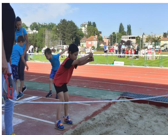
Mala olimpijada – županijsko sportska natjecanja u atletici i malom nogometu na stadionu Sloboda u Varaždinu