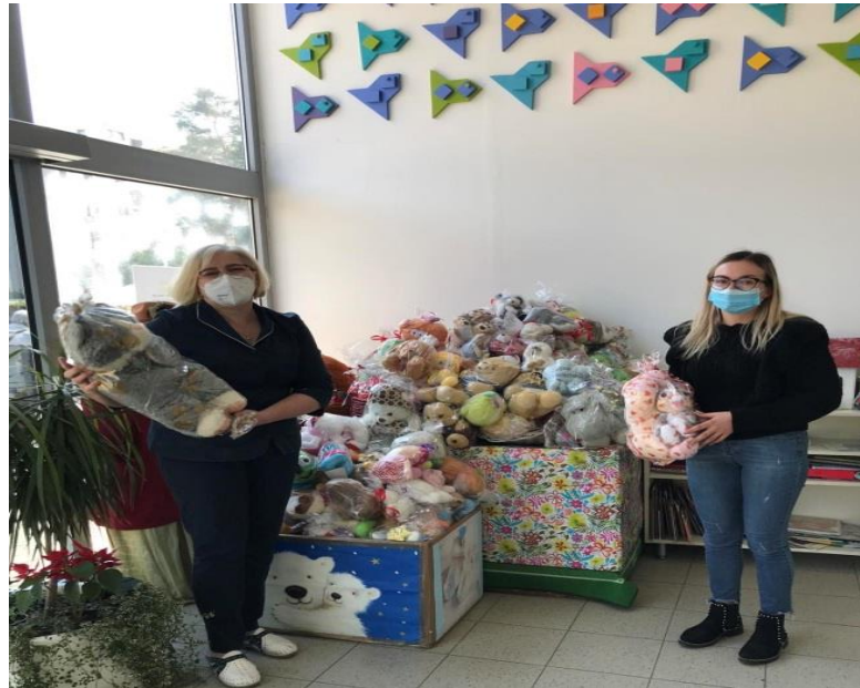
prigodna donacija za djecu u bolnici Rebro i pedijatriji varaždinske bolnice