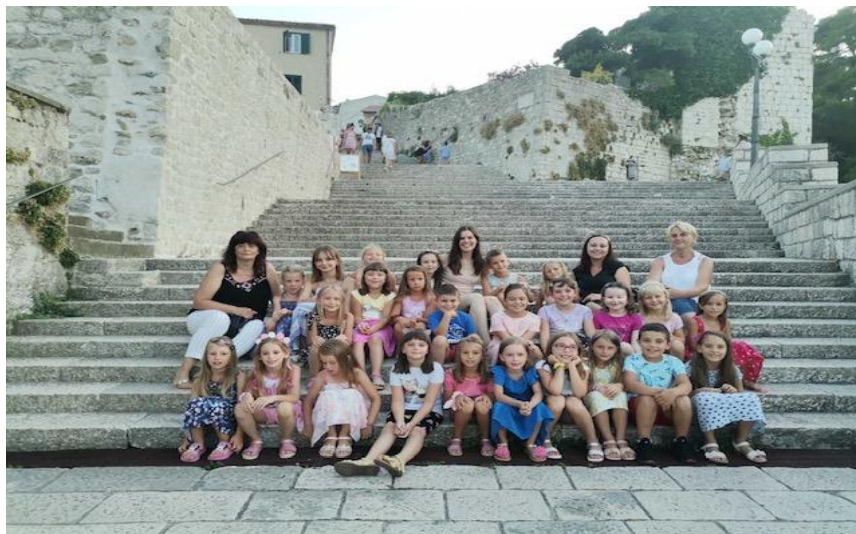
14. – 18.07 Ljetovanje u "Dječjem odmaralištu Varaždin na Rabu"