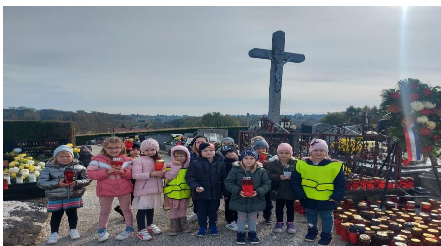
Dan mrtvih- odlazak na lokalno groblje