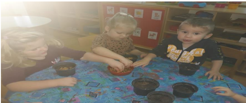
Sveta Lucija: sijanje pšenice

Način vrednovanja: Stručnu podršku (opservacija, praćenje djece, uvid u pedagošku dokumentaciju)